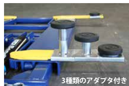
3種類のアダプタ付き