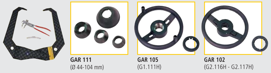
GAR 111 (Ø 44-104 mm)