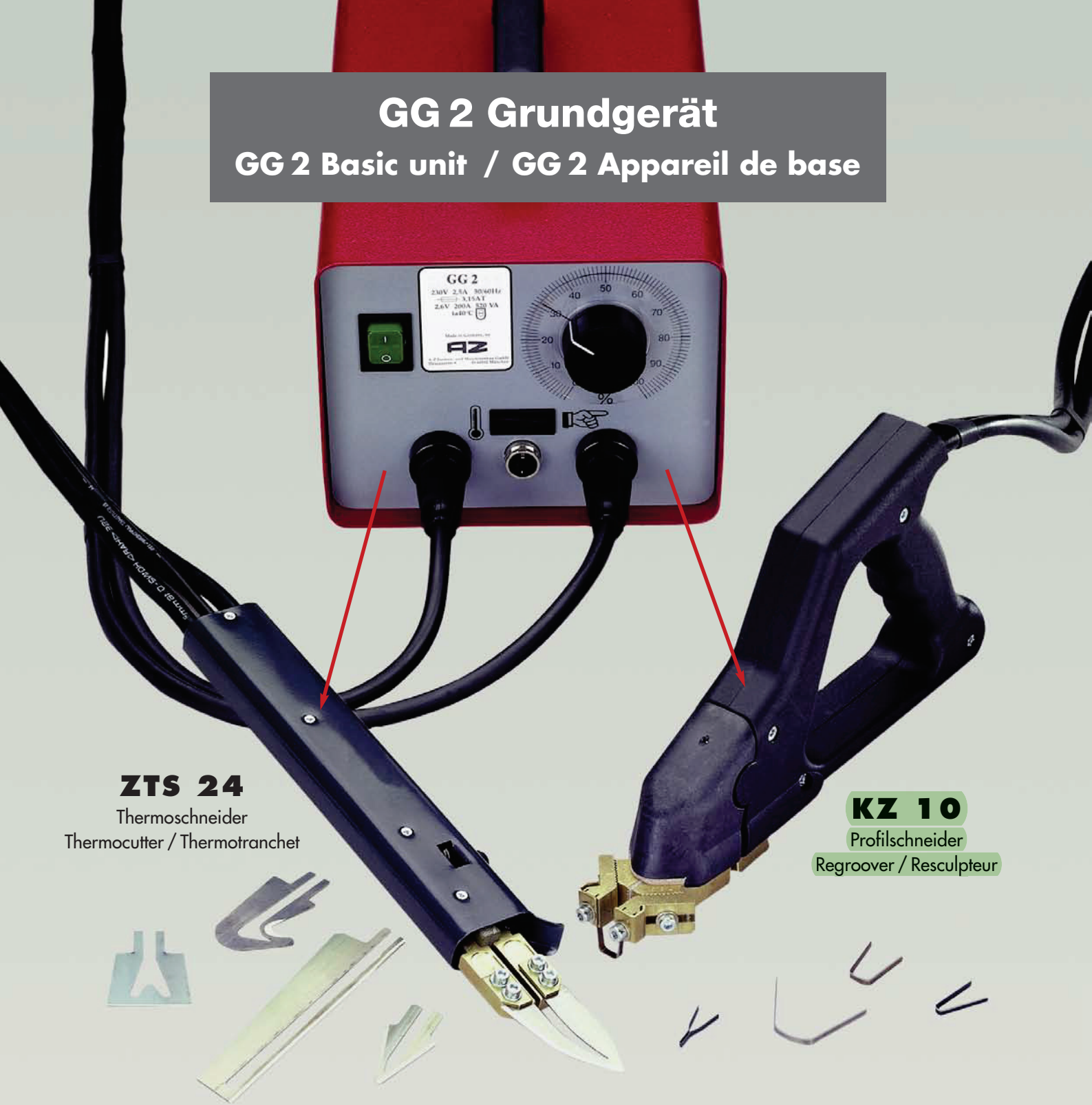
ZTS 24 Thermoschneider Thermocutter / Thermotranchet