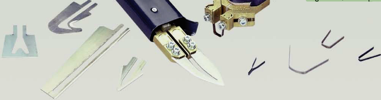
KZ 10 Profilschneider Regroover / Resculpteur